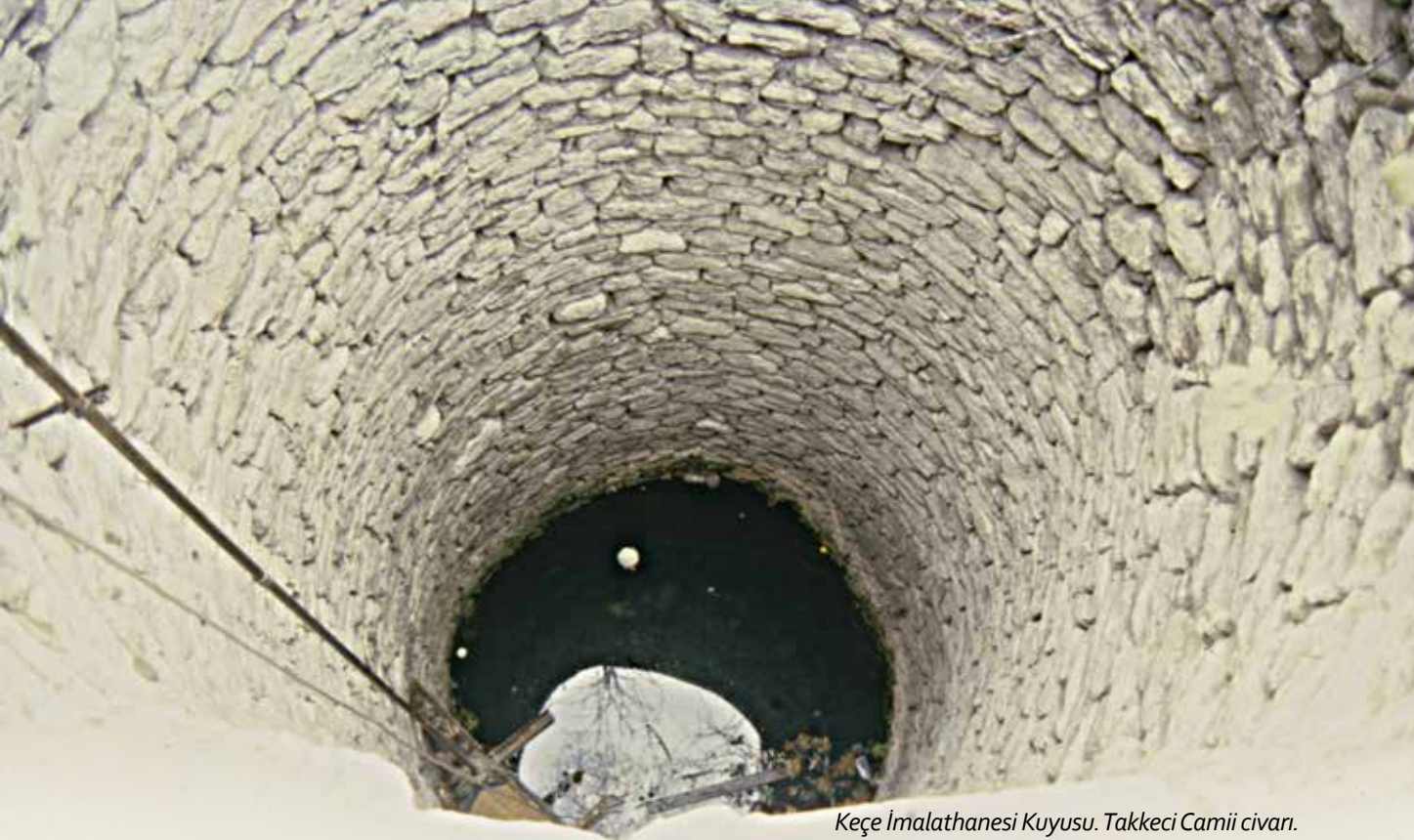
Keçe İmalathanesi Kuyusu. Takkeci Camii civarı.