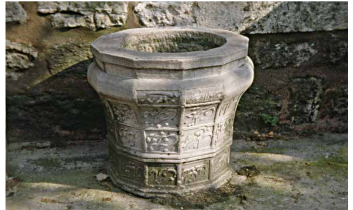
Topkapı Sarayı'na kaldırılmış kuyu bileziği