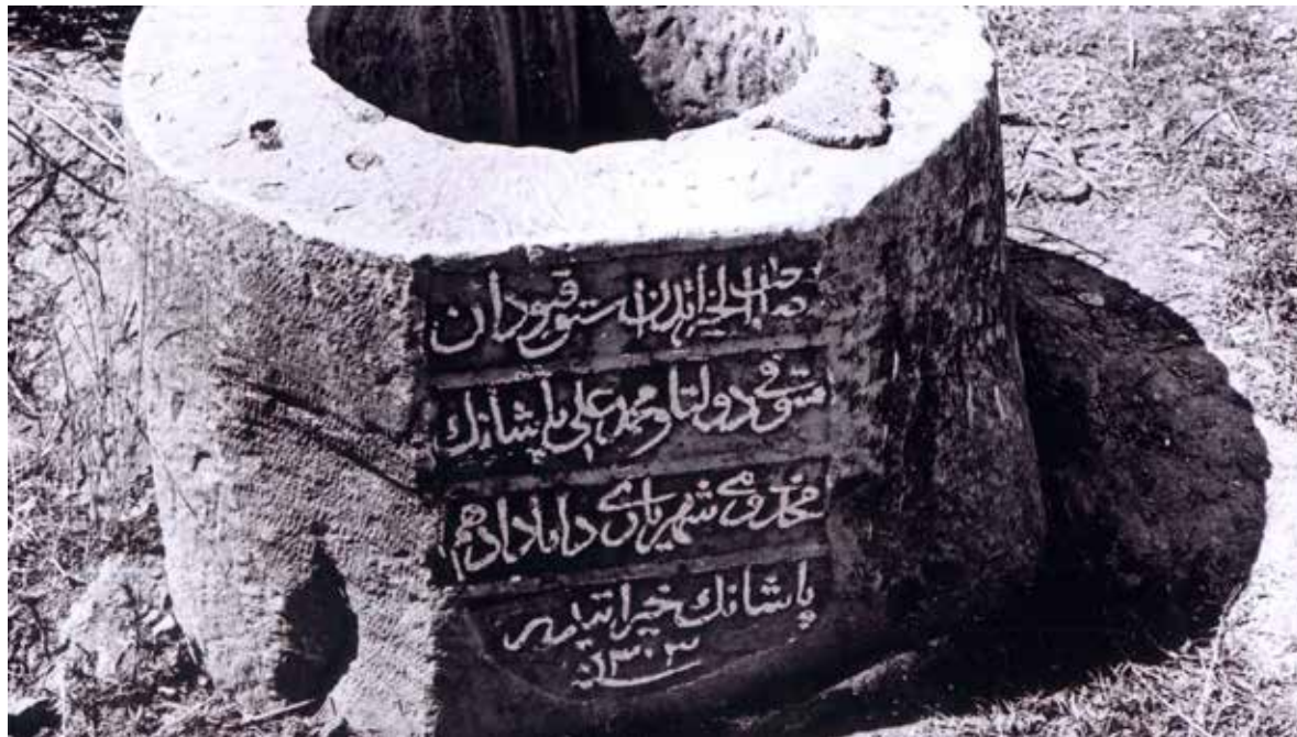
Günümüzde bulunmayan Karacaahmet Miskinler Tekkesi Kuyusu

daha sonra el tulumbaları bağlanarak su çekimi temin edilmiştir. Bazı Ayazma sularının şifalı olmaları sebebiyle bu yerlerde yapılan kuyulara Şifa kuyusu denilmiş, bir kısım tekke kuyusuna bazı mistik vakalar yakıştırılarak Niyet kuyusu adı verilmiş, özellikle bunların kuyu bileziklerine kutsallık izafe edilmiştir.