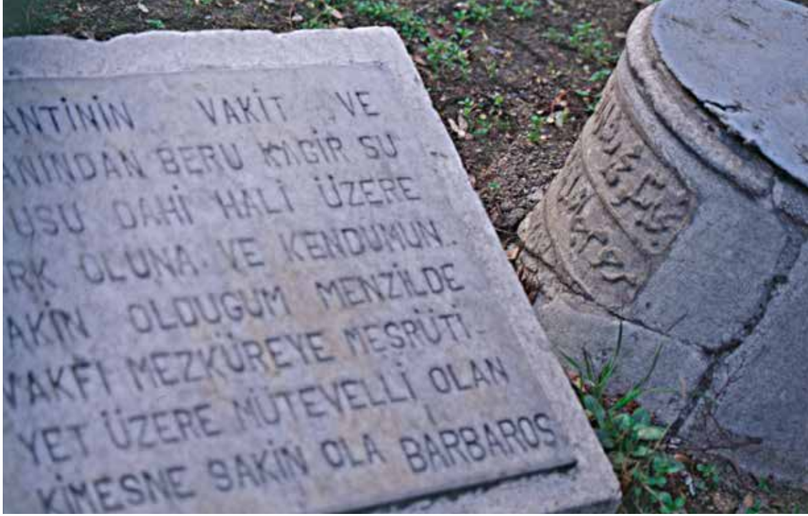
Barbaros Hayrettin Paşa'nın vaktiyle Beşiktaş'ta bulunan konağının bahçesindeki kuyu bileziği ve yazısını açıklayan kitabe. Günümüzde mevcut değildir.

Kar kuyuları, sebil içlerinde kışın içine kar depolanan hacimler olarak yapılmışlardır. Sebillerde yaz aylarında, buzdolabının olmadığı bir devirde soğuk içecek servisi bu sayede yapılabiliyordu. Sebillerde servis edilen Zemzem hariç tüm içecekler, kış aylarında kar kuyularında depolanan kar ile soğutuluyordu. Dolap kuyuları ise Bostan kuyuları gibi arazi içinde, at gücü ile döndürülen ve arazi sulamaya yarayan