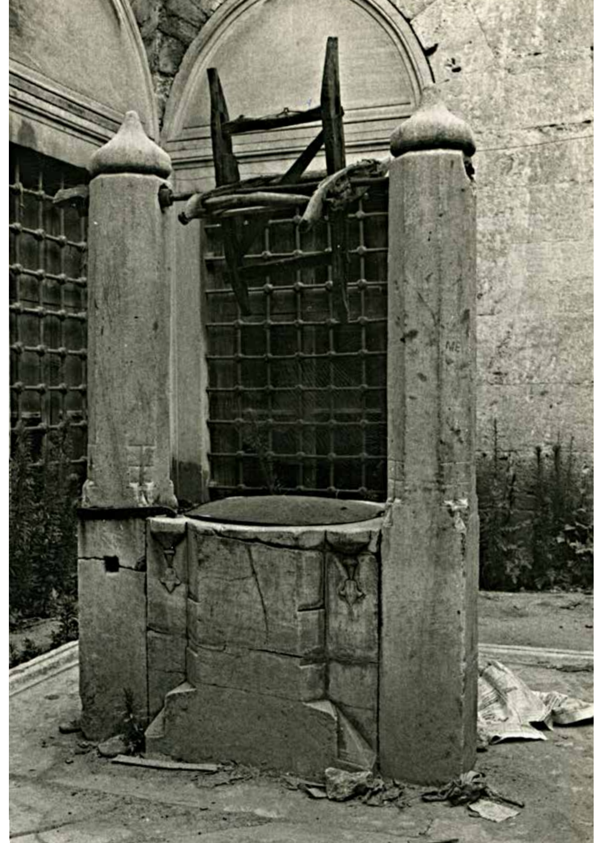
Bayram Paşa Tekkesi Kuyusu