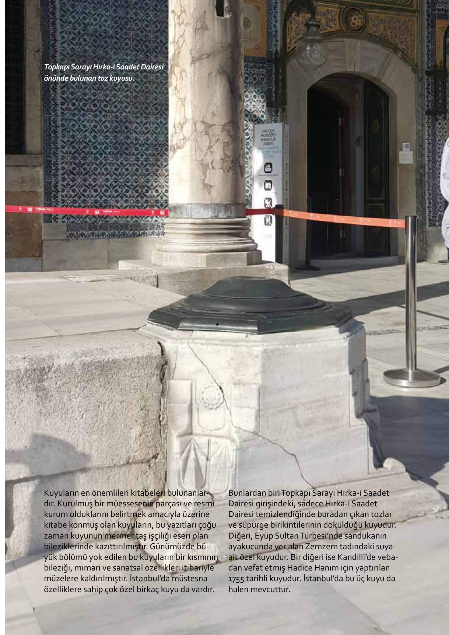
Topkapı Sarayı Hırka-i Saadet Dairesi önünde bulunan toz kuyusu.

Kuyuların en önemlileri kitabeleri bulunanlardır. Kurulmuş bir müessesenin parçası ve resmi kurum olduklarını belirtmek amacıyla üzerine kitabe konmuş olan kuyuların, bu yazıtları çoğu zaman kuyunun mermer taş işçiliği eseri olan bileziklerinde kazıtılmıştır. Günümüzde büyük bölümü yok edilen bu kuyuların bir kısmının bileziği, mimari ve sanatsal özellikleri itibarıyla müzelere kaldırılmıştır. İstanbul'da müstesna özelliklere sahip çok özel birkaç kuyu da vardır.