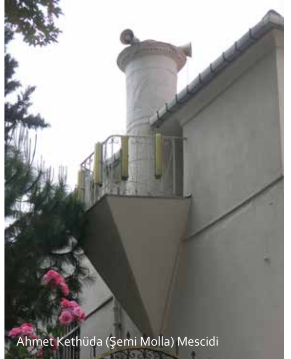
Ahmet Kethüda (Şemi Molla) Mescidi