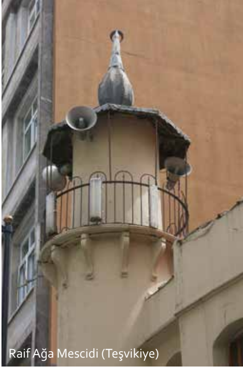
Raif Ağa Mescidi (Teşvikiye)