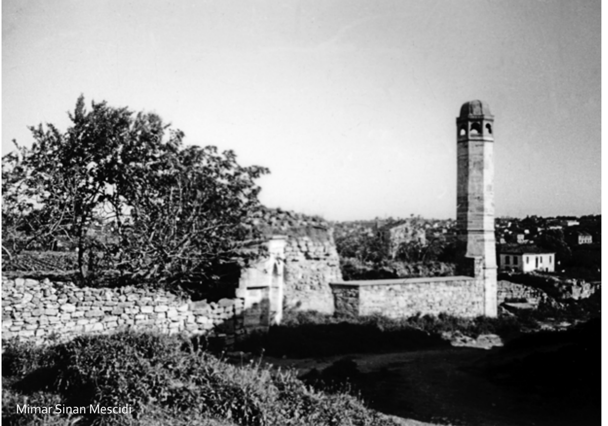
Mimar Sinan Mescidi

İstanbul mabetlerinin görünen en dikkat çekici noktaları minareleridir. İslami sembol olarak da kullanılan bu mimari unsur, şehrimizin ambleminde de yer almıştır. Minareler, tarih boyunca gerek tabii afetler ve gerekse mimari faaliyetler dolayısı ile değişikliklere uğramışlardır.