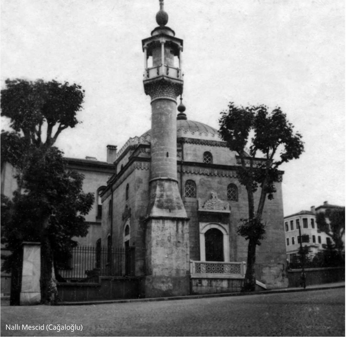
Nalli Mescid (Cağaloğlu)

Vezeneciler'de Camcı Ali Camii'nin minaresi istimlak edildiğinde, cami avlusunda camiye bitişik cami cemaati tarafından kerestelerden iskelemsi bir minare yapılarak, minare fonksiyonu yerine getirilmiştir. Daha sonraları Langa'da Şahügeda Camii'nin esas minaresi yıkık bulunduğu için cami duvarı üzerine yapılan uyduruk minare de harap olunca cami avlusuna, cemaat tarafından ahşap bodur bir minare yaptırılmıştır. Kalenderhane Camii ile Vatan Caddesi üzerindeki Molla Fenari Camilerine uzun seneler minare yapılamamış, bunların Bizans eseri olmalarından dolayı orijinal mimarilerinde minare olmadığı, muhtesat olduğu savı ile beklenilmiş çok sonra minareler yapılabilmektedir.