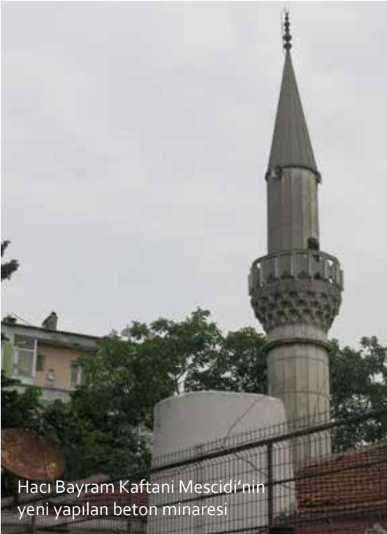
Hacı Bayram Kaftani Mescidi'nin yeni yapılan beton minaresi

Mimari programla resmi olarak inşa edilmiş, Vakıflar İdaresi denetiminde yapılmış minareler ve uygulamalar esas alınmalı, halkın cemaat uygulamaları minareler tasnif dışı bırakılmalıdır. Tekke vasfına haiz mabet minareleri de dikkate alınmalıdır. Günümüz modern mimarisinde eski ile ilgisi olmayan çok farklı tarzlarda yeni minareler yapılmaktadır.