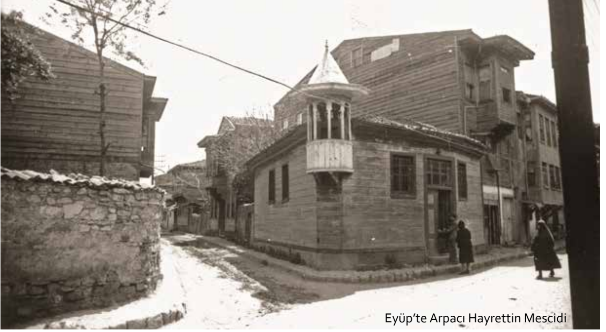
Eyüp'te Arpacı Hayrettin Mescidi

Eksiksiz bir minareler kataloğuna ihtiyaç vardır. Ancak zaman içinde değişen minarelerde meydana gelen bu değişikliklerin de saptanması gerekir. Minareler mimari görünüm, formuna göre sınıflandırılması gerekmektedir. Geçici yapılmış veya belli kısa bir süre var olmuş minareler bu tasnife alınmamalıdır.