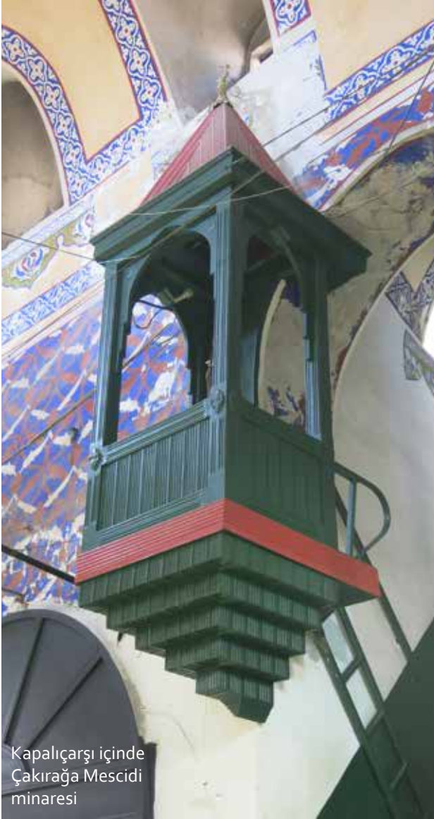
Kapalıçarşı içinde Çakırağa Mescidi minaresi