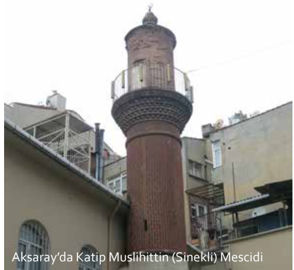
Aksaray'da Katip Muslihittin (Sinekli) Mescidi

Vezeneciler'de Camcı Ali Camii'nin minaresi istimlak edildiğinde, cami avlusunda camiye bitişik cami cemaati tarafından kerestelerden iskelemsi bir minare yapılarak, minare fonksiyonu yerine getirilmiştir. Daha sonraları Langa'da Şahügeda Camii'nin esas minaresi yıkık bulunduğu için cami duvarı üzerine yapılan uyduruk minare de harap olunca cami avlusuna, cemaat tarafından ahşap bodur bir minare yaptırılmıştır. Kalenderhane Camii ile Vatan Caddesi üzerindeki Molla Fenari Camilerine uzun seneler minare yapılamamış, bunların Bizans eseri olmalarından dolayı orijinal mimarilerinde minare olmadığı, muhtesat olduğu savı ile beklenilmiş çok sonra minareler yapılabilmektedir.