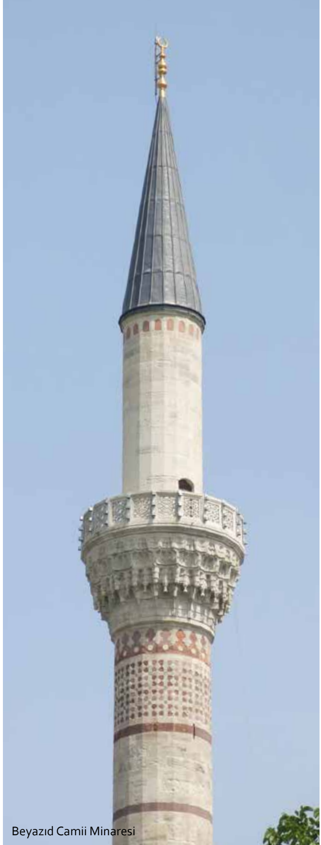
Beyazıt Camii Minaresi

Bir kısım İstanbul tekke yapısı bunun dışındadır. Minarelerle ilgili yayınlarda, eski kayıtlarda Farisili, Mahrutî, Haşebi, Müzeyyen gibi terimler kullanılmıştır. En çok "Tahta Minare" ifadesine rastlanılmaktadır. Minarelerin tepesi konik olanlarına Mahrutî, gövdesinin taş işçiliği çokgen kesitli olanlara Farisili, gövdesi taş ve tuğla süslü işçilikli olana Müzeyyen, şerefesi kesitli kesme taşla tamamen kapalı olanına Köşk, şerife mihver sakfı kapalı (sütunlu- saçaklı) olanına Fener ve tamamen ahşap olanına da Haşebi tabiri kullanılmıştır.