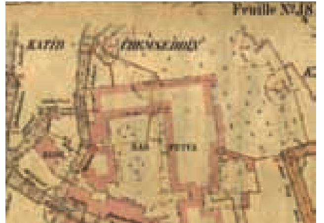
Alman Mavileri haritasında Bab-ı Meşihat