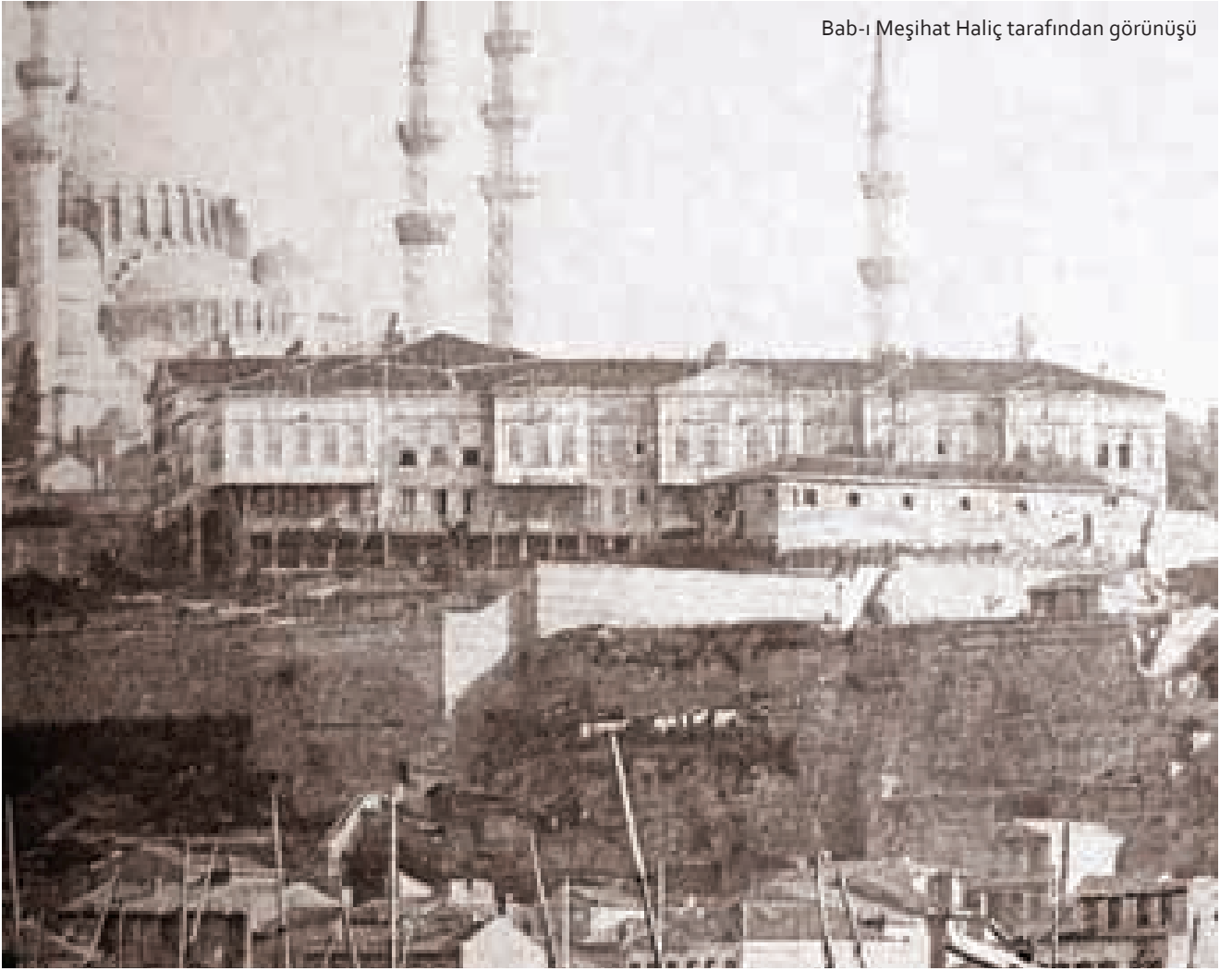
Bab-ı Meşihat Haliç tarafından görünüşü

Bab-ı Meşihat'in 1900'lü yılların başındaki fotoğraf ve haritalara göre geniş bir avlu etrafında 3 katlı Fetvahane binası ile birlikte "U" formu oluşturan, Neo-Klasik tarzda kargir olarak inşa edilmiş 2 katlı yapılardan oluştuğu görülmektedir. Şeyhülislam dairesinin