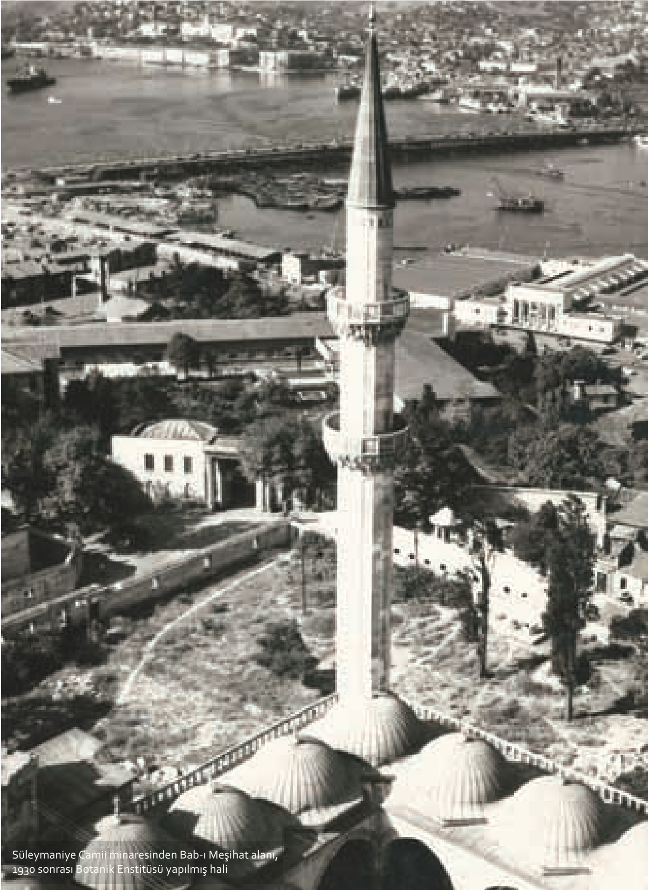
Süleymaniye Camii minaresinden Bab-ı Meşihat alanı, 1930 sonrası Botanik Enstitüsü yapılmış hali