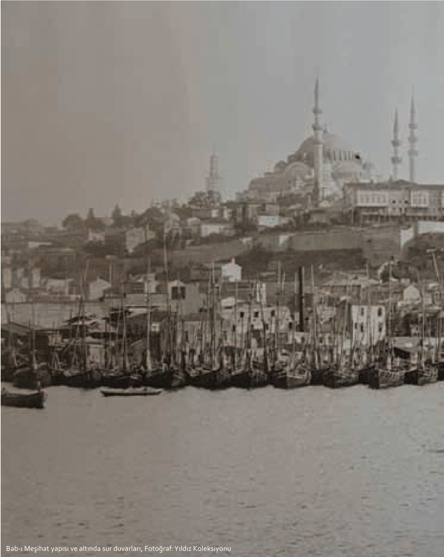
Bab-ı Meşihat yapısı ve altında sur duvarları