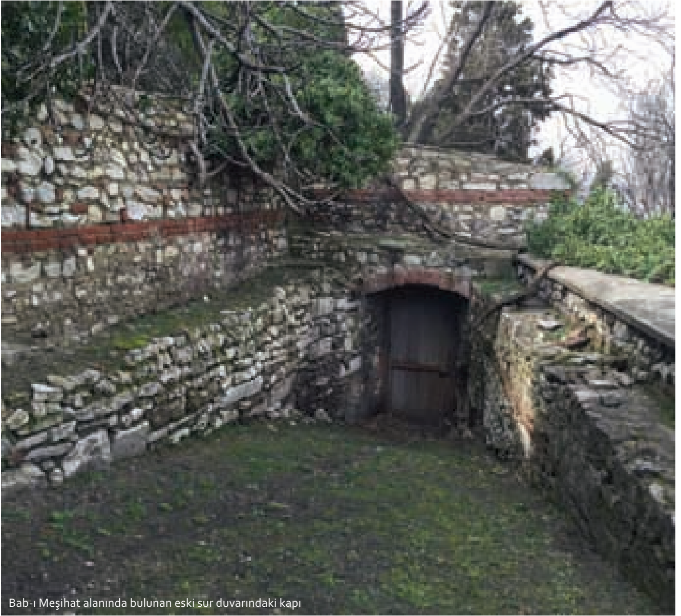
Bab-ı Meşihat alanında bulunan eski sur duvarındaki kapı

Kaynaklarda Bab-ı Fetva ve Fetvahane olarak da geçen Bab-ı Meşihat, şeyhülislamlık dairesi, fetvahane, İstanbul kadılığı dairesi, meclis-i meşayih dairesi, nakibüleşraf dairesi, Şura-i İlmiye dairesi gibi birçok birimi bünyesinde barındırmakta idi. Tam ve ayrıntılı teşkilat yapısı ilmiye salnamesinde verilmiştir. Süleymaniye Camii'ne bakan tarafta Ampir üsluptaki anıtsal cümle kapısının dış tarafında, Hicri 1241 tarihli Yesârîzade Mustafa İzzet tarafından celi talik hattıyla yazılmış Ağakapısı'nın şeyhülislamla tahsis edildiğini bildiren bir kitabe yer almaktadır. Kapının iç kısmında ise 2. Abdülhamid devrinde burada yapılan yeni inşa ve tadilat çalışmaları dolayısıyla Vakanüvis Lütfi tarafından yazılan bir kitabe yer almaktadır. Bu anıtsal kapıdan girilen geniş bir alana sahip olan Bab-ı Meşihat'ta, günümüzde sadece