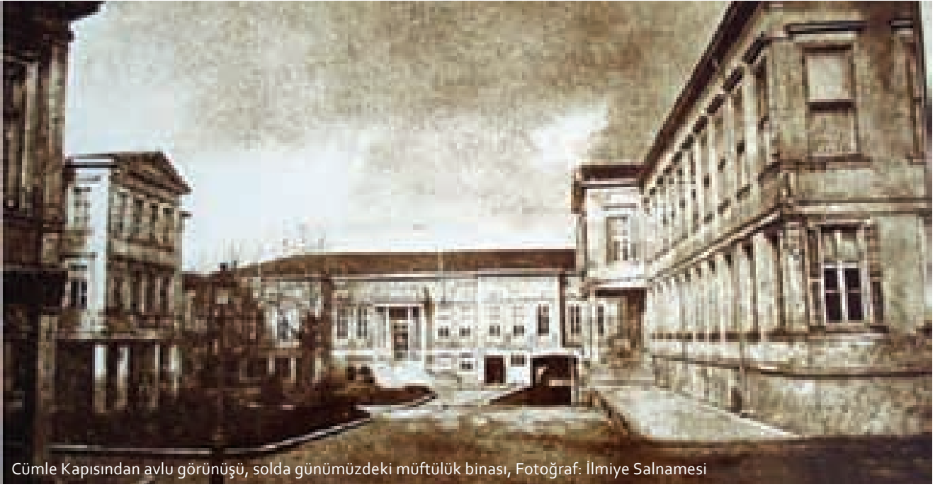
Cümle Kapısından avlu görünüşü, solda günümüzdeki müftülük binası, Fotoğraf: İlmîye Salnamesi

Tahtakale (Taht'el Kal'a) yani kale altı ismi de buradan gelmektedir. Bu da sahanın daha evvel askeri bir saha olduğunu göstermektedir. Cumhuriyet'in ilanından sonra Şeyhülislamlığın kaldırılmasıyla, burası İstanbul Müftülüğü olarak kullanılmaya devam etmektedir. Osmanlı devletinde nezaretler kuruluncaya kadar devlet erkânı, kendi konaklarının selamlık bölümlerini resmi daire olarak kullanırlardı. Şeyhülislamların da müstakil daireleri yoktu. Şeyhülislam olan zatlar oturdukları konağın