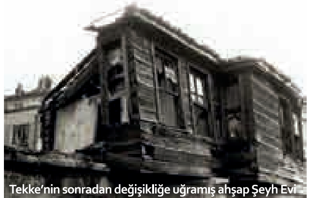
Tekke'nin sonradan değişikliğe uğramış ahşap Şeyh Evi

Sinan külliyelerinden, Atik Valide'de ve Gebze Çoban Mustafa Paşa'da ayrı tekke vardır. Esas girişi cami girişinin aksi yönünde güneydoğudadır. Tekke, tevhidhane, derviş hücreleri, selamlık odaları, mutfak, gusülhane gibi unsurları barındırmaktadır. Tekke başlangıçta ayin günü perşembe olan halvetiyle tarikatına bağlı iken sonradan değişmiştir. Su Terazisi Sokak tarafındaki kapı, 6 sütunlu, 2 tonozlu giriş holüne ve dıştan dışa 13.50m x 9.25m boyutlarındaki dikdörtgen tevhidhaneye açılır. Tevhidhanenin doğusunda tek katlı ve batısında çift katlı hücreler vardır. Ortalama 2.60m x 2.60m olan hücrelerin önünde sade sütunlu ahşap çatılı revak bulunmaktadır. İki farklı katı, avlunun kuzeyindeki duvara bitişik merdiven birleştirmiştir. Hücrelerin sonunda günümüze ulaşmayan ahşap 2 katlı şeyh evi vardı. Altında tek halvetli gusülhane (hamam) bulunan tevhidhanede, mihrap kible yönünün zıddı yöndedir.